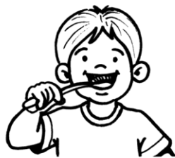
Me lavo los dientes