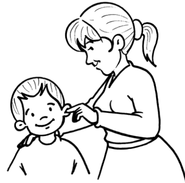
Aseo mis oídos