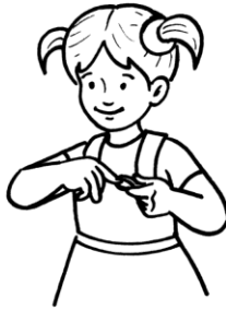
Corto mis uñas