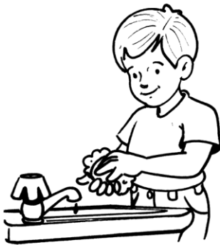
Me lavo las manos