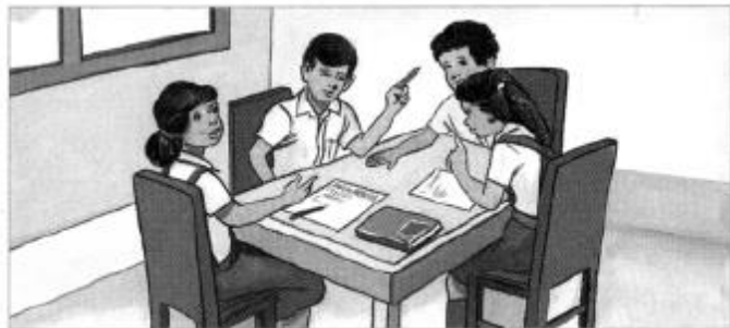
• La brigada de Defensa Civil preparando su plan de trabajo.

Ahora con esta práctica puedes organizar tu brigada de Defensa Civil en tu aula o en la escuela, para lo cual tendrás las siguientes áreas de trabajo: