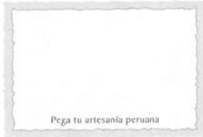
Pega tu artesanía peruana