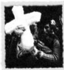
El Señor de Qoyllur Rit'i, en el Cusco, es la fiesta indígena más grande de América, que se realiza en las faldas del nevado de Ausangate, en junio.