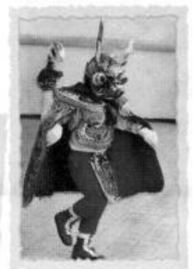
La diablada de Puno