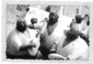
Cerámica de Chulucanas (Piura)

La artesanía es muy variada. A través de ella, los pueblos expresaron sus vivencias, actividades cotidianas, religiosidad y forma de ver el mundo.