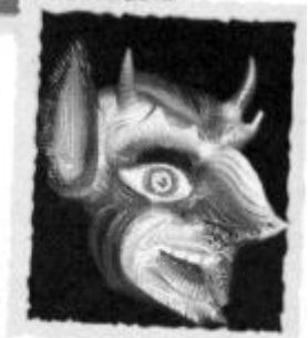
Máscara de la diablada de Puno, con rasgos de demonio, ángel, negro y animal.