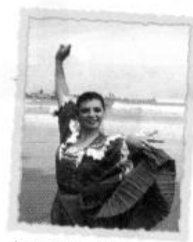
La marinera, baile nacional