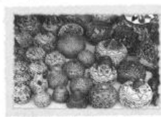
Mates burilados, los cuales son grabados en calabazas secas o mates (Huancayo)