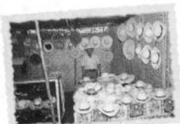
Sombreros de paja