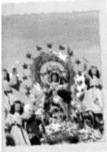
Fiesta de la Virgen de la Candelaria, en Puno, durante el mes de febrero.

Generalmente, las fiestas tienen dos facetas: una sagrada, llena de fe y devoción, y otra llena de algarabía, colorido, diversión y bullicio. Las fiestas más populares son: