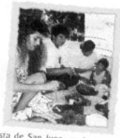
Fiesta de San Juan, en Loreto, los días 23, 24 y 25 de junio, en honor al Santo Patrono de la Amazonía.