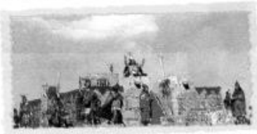
En Cusco, el Inti Raymi o fiesta del Sol, que se realiza como agradecimiento por las cosechas en el Sacsayhuamán el 24 de junio de cada año.