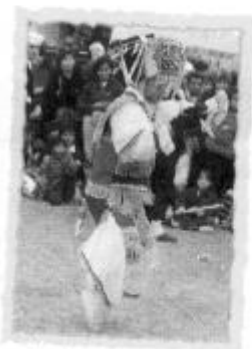
Baile de las tijeras.

La música y el baile son las actividades artísticas populares más difundidas en nuestro país; es así que existe gran cantidad de géneros musicales como el huayno, la chicha o cumbia peruana, el vals y la marinera. En cuanto a danza hay más de 1500 expresiones, que constituyen nuestro patrimonio. Algunas son: el festejo, la marinera, la zamacueca, el tondero, la pandilla, el santiago, el huaylas, la danza de las tijeras, la tunantada, las pallas y la diablada, entre otras.