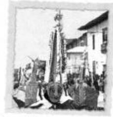
Carnaval de Cajamarca, durante los meses de febrero y marzo, es la fiesta más vistosa del país.