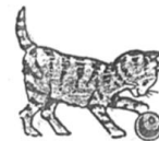
El gato .....