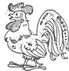
El gallo .....